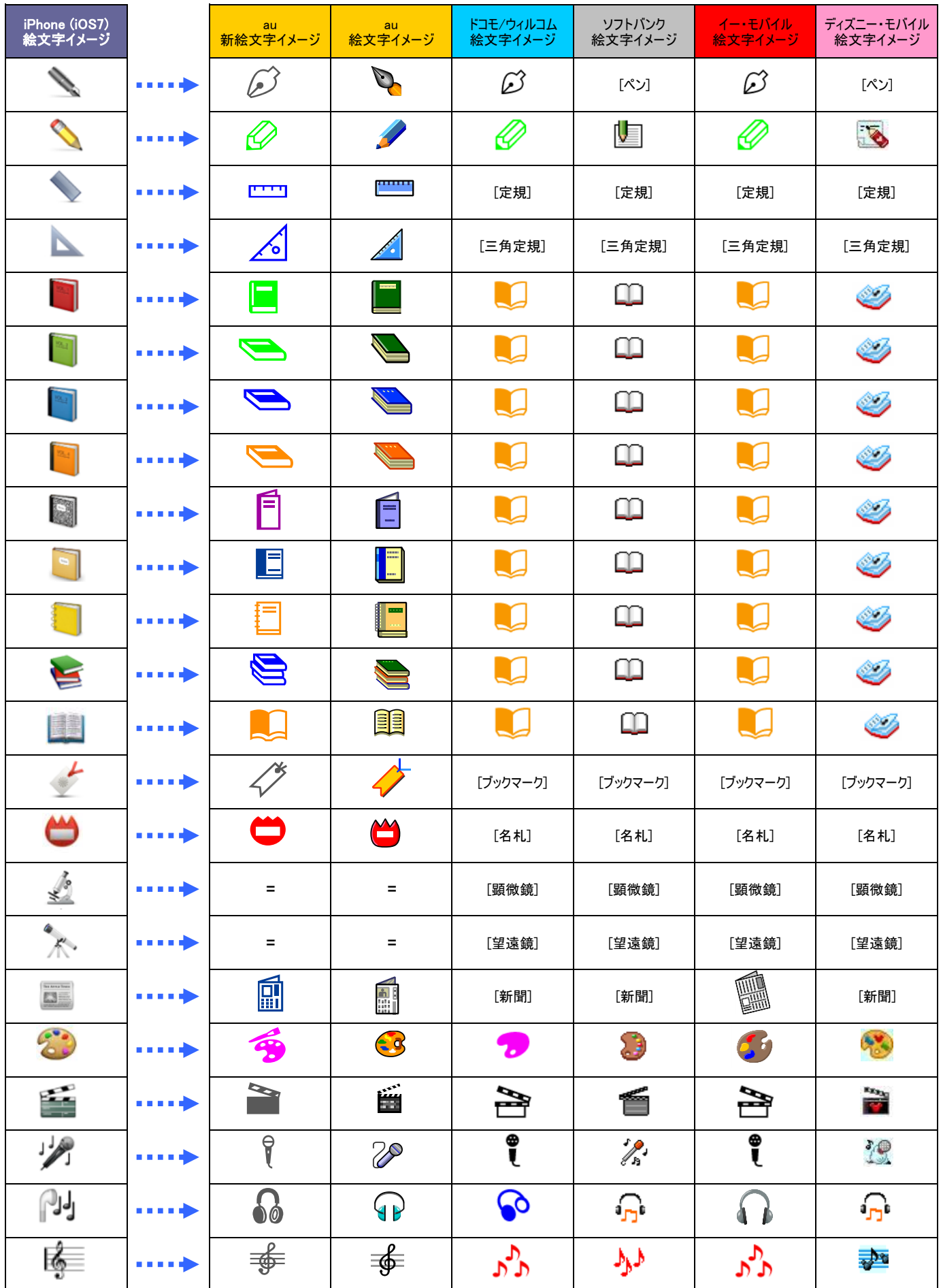
【絵文字対応表】iPhone → 他社/au (iPhone以外)