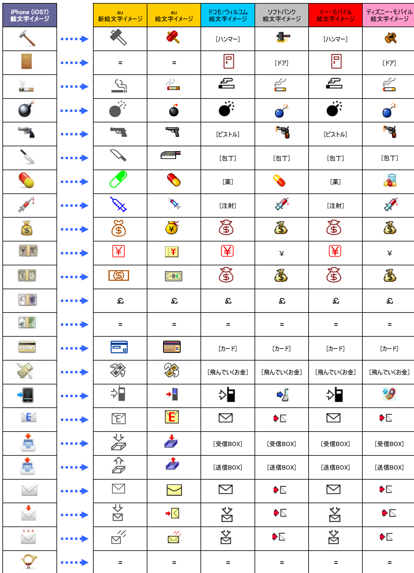
【絵文字対応表】iPhone → 他社/au (iPhone以外)