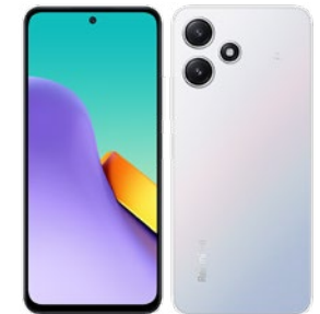
ポーラーシルバー