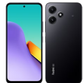
ミッドナイトブラック

※5Gは一部エリアで提供。詳しくはauまたはUQホームページでご確認ください。5G SAに対応しています。5G SAは一部エリアで提供しています。