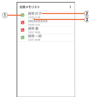
《伝言メモリスト画面》