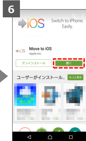
ボタンが「開く」になるとインストール完了です