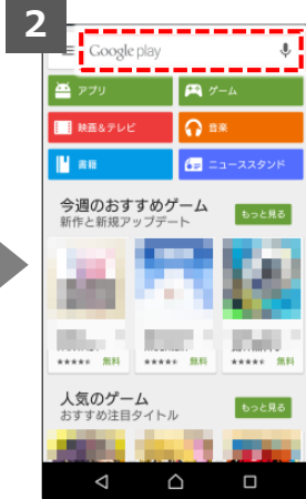
検索窓で「Move to iOS」を検索