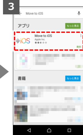
「Move to iOS」をタップ