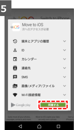
「同意する」をタップ