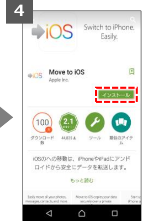
「インストール」をタップ