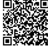
au Market版 データお預かりアプリ への戻し方