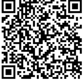
au Market版 データお預かりアプリ ダウンロードページ