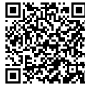
au Market版 データお預かりアプリ への戻し方