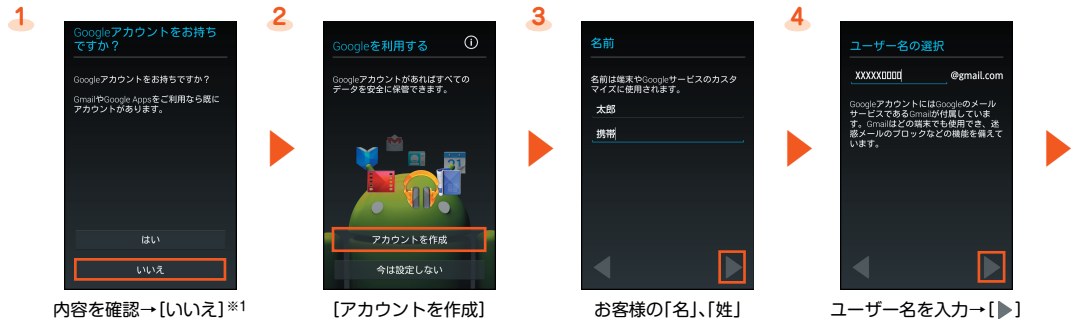
内容を確認→「いいえ」※1