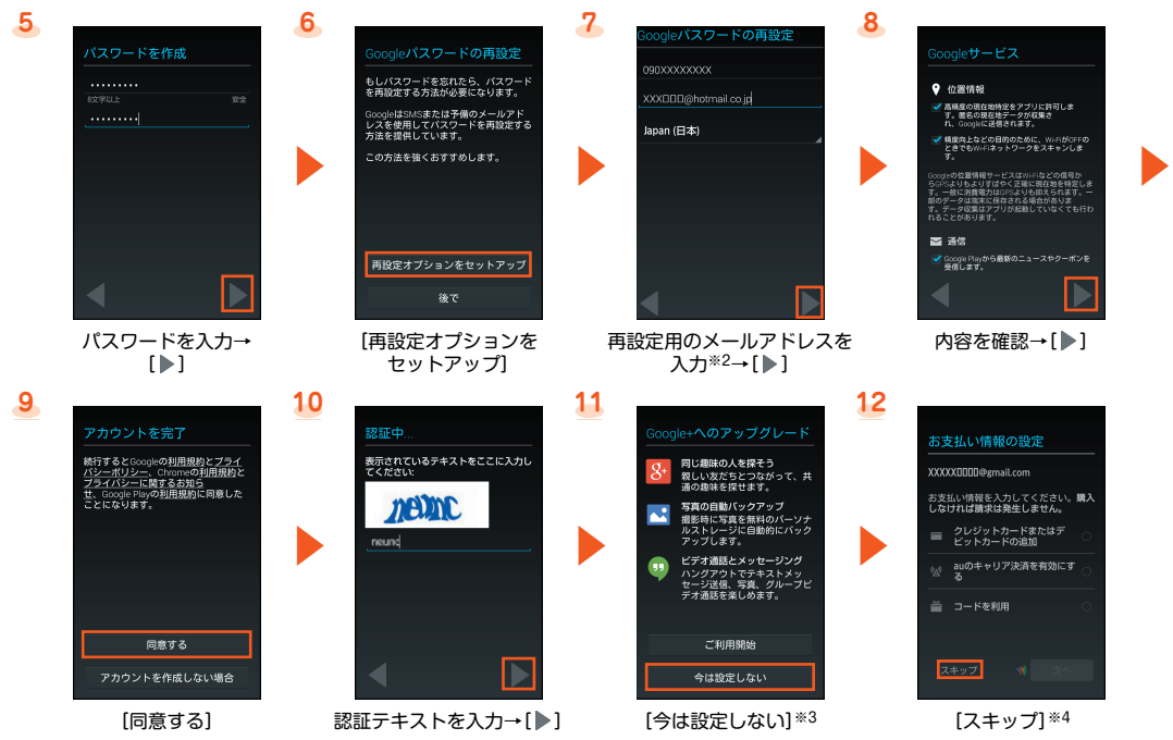
パスワードを入力→[▶]