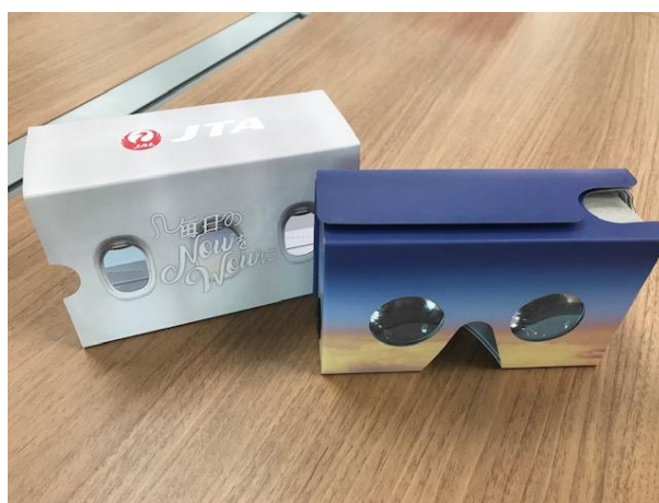
<簡易ゴーグル「ハコスコ」のイメージ>