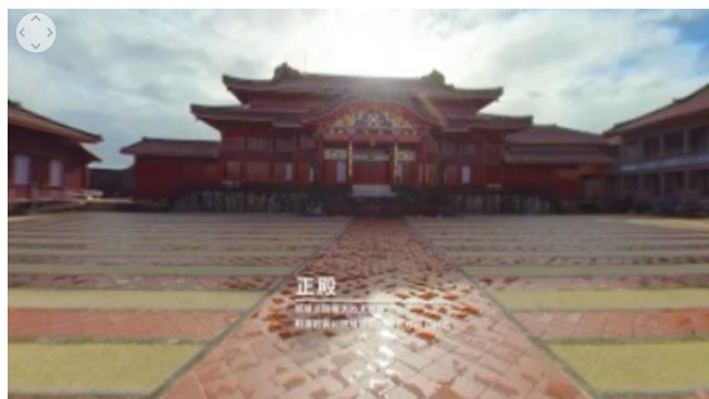
<VR コンテンツの体験イメージ>

加えて、2020 年 2 月 4 日から「首里城復興応援プロジェクト」の特設ページ