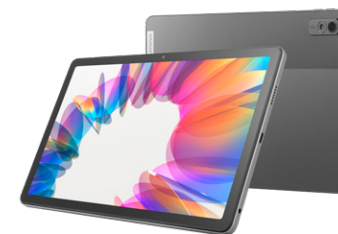
アークティックグレー