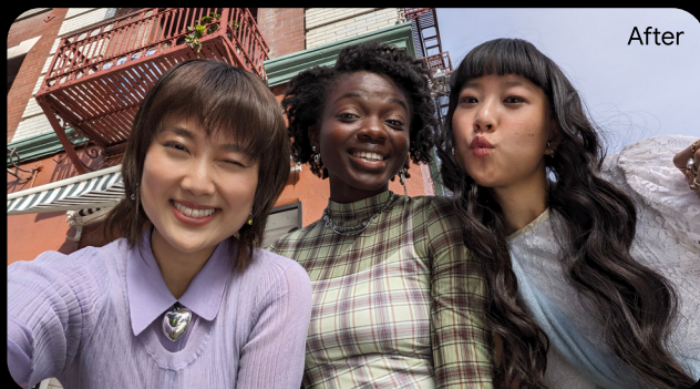
ベストな1枚を作成

*1 Google Pixel の旧モデルとの比較。*2 インターネット接続と対応アプリおよび対応サーフェスが必要です。結果は映像の一致状況によって異なります。