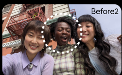
目をつぶっている