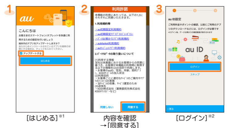
1 [はじめる]※1 2 内容を確認 → [同意する] 3 [ログイン]※2

※ 1 端末内のアプリをアップデートする場合は、「アップデートする」にチェックを入れてください。