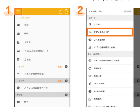
1 ホーム画面で[設定] → [Eメール情報]