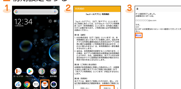
1 ホーム画面で[設定] → [Eメール情報] → [Eメール設定] → [完了] 2 内容を確認 → [同意する] → 内容を確認 → [同意する] → 画面の指示に従って操作し、次へ進む 3 auメールアドレスを確認 → [閉じる]