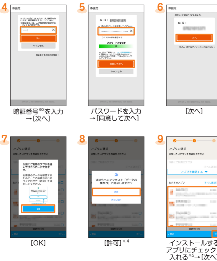
4 暗証番号※3を入力 → [次へ] 5 パスワードを入力 → [同意して次へ] 6 [次へ] 7 [OK] 8 [許可]※4 9 インストールするアプリにチェックを入れる※5 → [次へ]

※ 2 以前にau IDを登録したことがある場合、手順4と手順5は表示されません。手順6に進んでください。