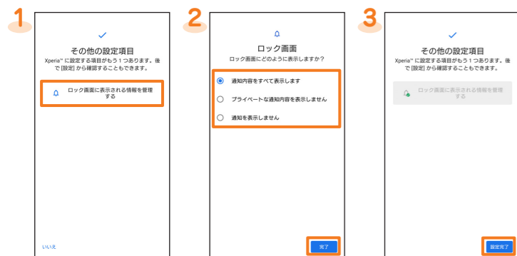
1 [ロック画面に表示される情報を管理する]※1 2 通知方法を選択 → [完了] 3 [設定完了]

※ 1 その他の設定項目の設定を変更せずに終了する場合は「いいえ」をタップします。