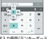
(文字入力画面(テンキーボード))

キーに触れると、右の画面のようにフリック入力が入力できる候補が表示されます。入力したい文字が表示されている方向にフリックすると、文字入力エリアに文字が入力されます。