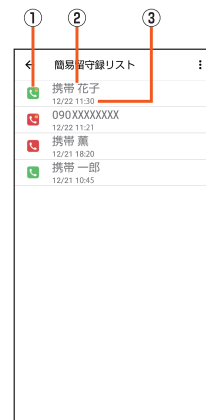
《簡易留守録リスト画面》